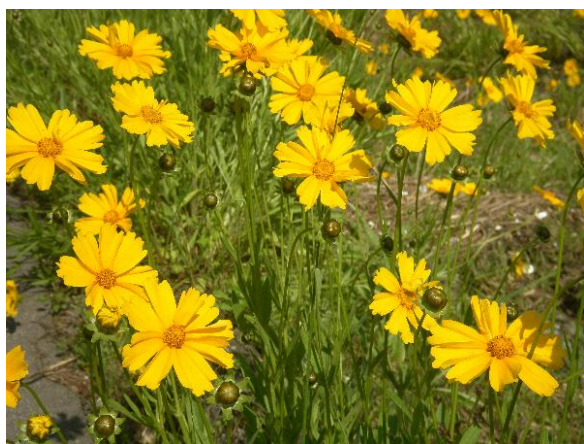
〔駆除対象のオオキンケイギク〕